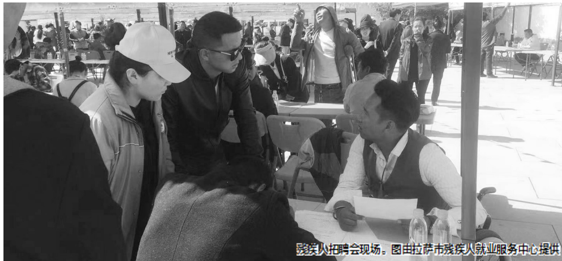
残疾人招聘会现场。

近年来,在拉萨市委、市政府的高度重视下,拉萨市相继出台了《拉萨市残疾人保护管理办法》《拉萨市按比例安置残疾人就业及就业保障金征收管理办法》等一系列符合拉萨实际情况的残疾人事业政策法规,法律体系不断建立完善。