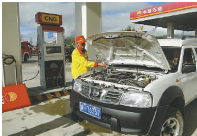
加气站工作人员给车辆加气。记者 麦朵 摄

的发展历史,可以追溯到上世纪 90 年代。1992 年 7 月,西藏石油总公司液化气经销分公司成立,来自青海格尔木炼厂的液化石油气进入西藏,结束了当地人民以干牛粪为主要燃料的历史。“目前液化石油气已进入了千家万户,与液化石油气相比,液化