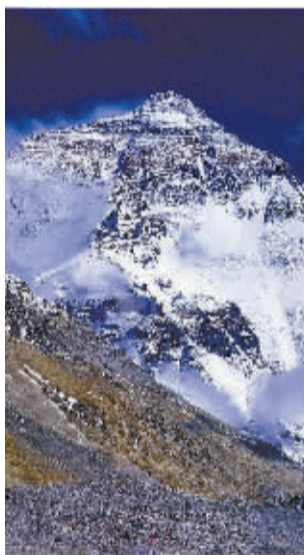
此次推介会以“从珠峰朗玛到神山圣湖”为主题着重宣传。

日喀则地区有“千山之宗,万水之源”之称。近年来,日喀则坚持和谐开发的理念,努力改善旅