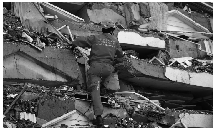
2月8日,在土耳其南部卡赫拉曼马拉什市中心,救援人员在搜救。

乌克兰政府日前也宣布,由87人组成的团队将被派往土耳其协助救灾。乌克兰总统泽连斯基还表示,已向土耳其总统埃尔多安通话,对地震给土耳其人民带来的悲剧深表哀悼。(中新社)