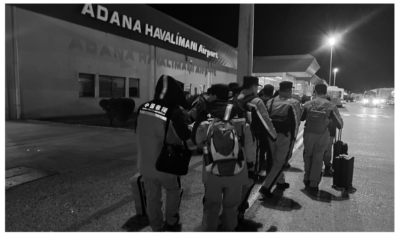
2月8日,中国救援队抵达土耳其阿达纳机场。