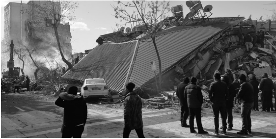
灾民在土耳其南部卡赫拉曼马拉什市一处地震废墟前。

强震在土耳其和叙利亚造成的遇难人数仍在不断攀升,目前已有超7800人死亡。土耳其总统埃尔多安7日宣布,受地震影响的10个省将实施为期3个月的紧急状态。与此同时,救援仍在争分夺秒地进行中。世界卫生组织总干事谭德塞强调:“现在是与时间的赛跑。”