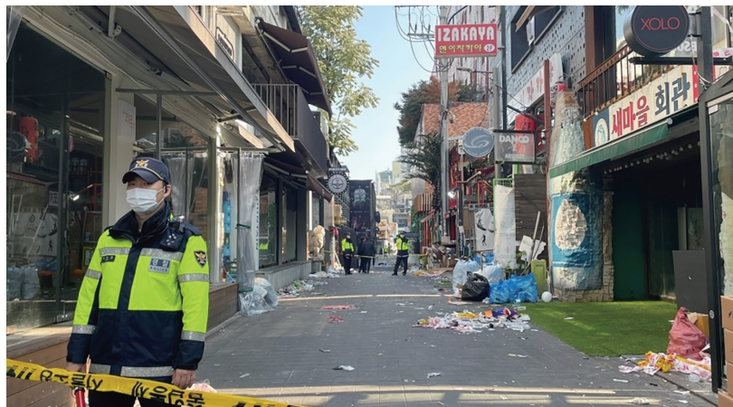
当地时间10月30日,事发巷口已封路。

韩国总统尹锡悦在就事故做出两次紧急指示后,于当地时间30日凌晨在龙山总统府召开紧急状况检查会议。