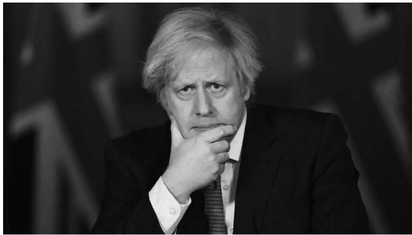
即将离任的英国首相约翰逊。

近日,据外媒报道,由于“派对门”“训党鞭性骚扰”等一系列丑闻事件,即将离任的英国首相约翰逊在英国国内的声望已大幅下跌。但是他在乌克兰依然是一个很受欢迎的人物,这主要是因为他在这俄乌冲突中站队乌克兰,对乌方表达了明确的支持。