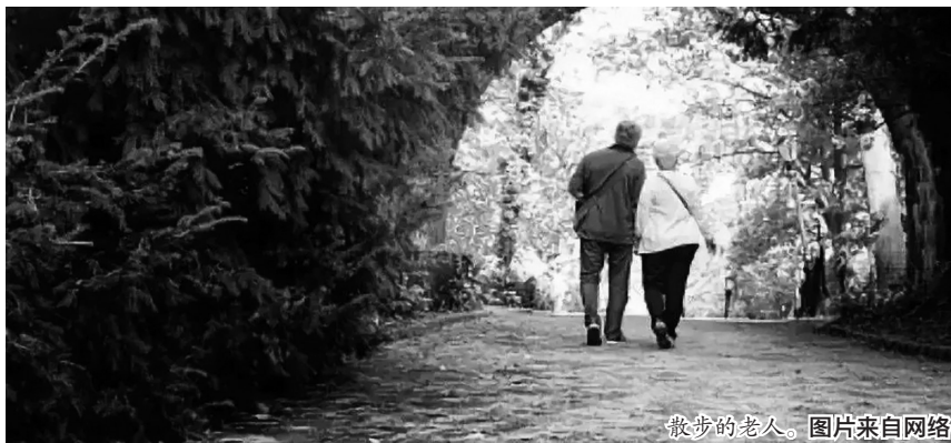
散步的老人。

某券商金融工程研究员给记者算了一笔账,即使偏股型基金的年化收益率降低至15%，“在20年后,最佳情况下,你缴纳的24万元本金可以增长至132.7万元。当然,这仅仅是模型的假设,因为养老基金有下滑曲线模型,它不可能全部买权益类资产,最终能否