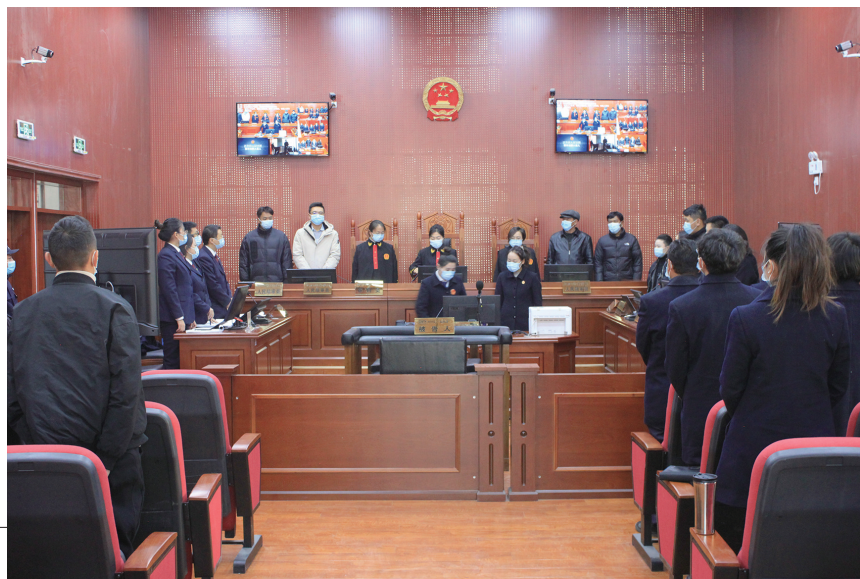
丁某某等4人非法捕捞水产品刑事附带民事公益诉讼一案庭审现场。

自治区检察院第八检察部主任王旭东表示,生物多样性关系人类福祉,是人类赖以生存和发展的重要基础,人类必须尊重自然、顺应自然、保护自然,加大生物多样性保护力度,促进人与自然和谐共生。同时,全区检察机关也将充分发挥公益诉讼检察职能,加大生态环境和资源保护领域的办案力度,使受损的生态环境得到及时、有效地修复和补偿,实现惩治违法犯罪和保护生态环境的双赢局面。