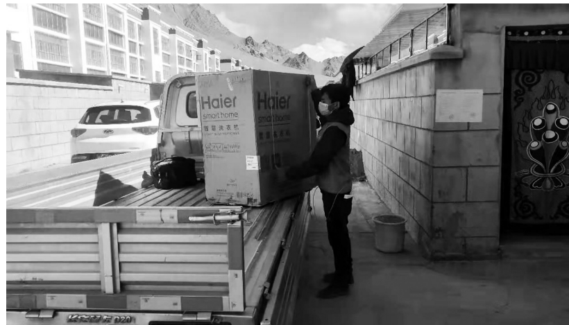
京东快递员在送货。

2月26日,河北省援藏工作队发改、旅发、市场监管、公安等领域的工作人员与京东集团西藏区域负责人进行了座谈,双方就阿里旅游与京东合作、京东物流进一步延伸、阿里旅游商品开发网销等进行了深入探讨。京东集团表示,阿里地区由于交通不便,作为一