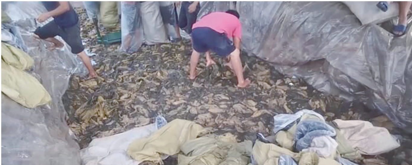
土坑酸菜。截图自央视3·15晚会