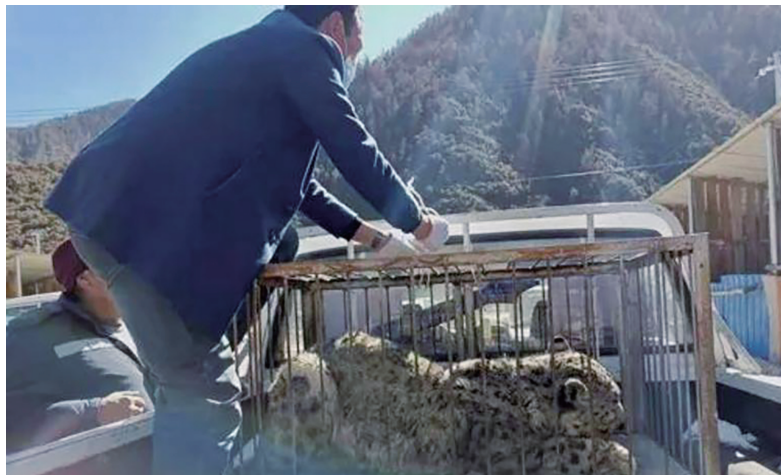
救护人员将雪豹运送至野生动物收容救护站。

据悉,为确保救护工作的专业性、科学性,林芝市林草局及时与西藏农牧学院有关专家进行沟通,研究制定科学的康复饲养、收容救护方案,并将持续做好雪豹后期恢复