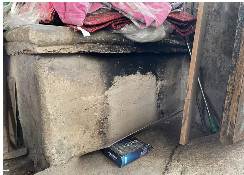
山海关古城东安家胡同一户居民家中炉灶被封堵。

12月20日,总台央广中国之声独家报道了“河北山海关古城清洁取暖被指‘一刀切’,禁止烧柴取暖、封堵炉灶导致部分群众挨冻”一事。报道播出后,当地表示立即整改,确保群众无忧过冬。