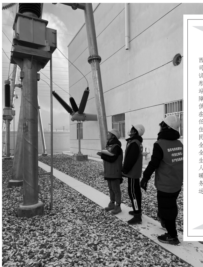
国网西藏电力工作人员正在检修设备。

近日,国网西藏电力有限公司召开专题会议,进一步认清形势,提高政治站位,切实将保障电力安全可靠供应作为初心所在、使命所在、责任所在,坚决守住大电网安全和民生用电底线,全力以赴保安全、保供电、保民生、保服务,确保人民群众安全温暖过冬,全力服务经济社会平稳运行。