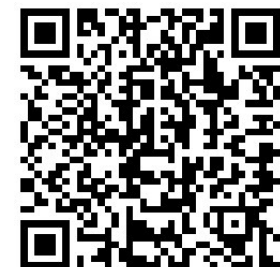
扫描二维码,了解更多内容。

今年清明节前,部队将9位和静籍蒙古族烈士入阿里烈士陵园迁回和静烈士陵园。至此,英雄魂归故里,亲人得以抚慰。