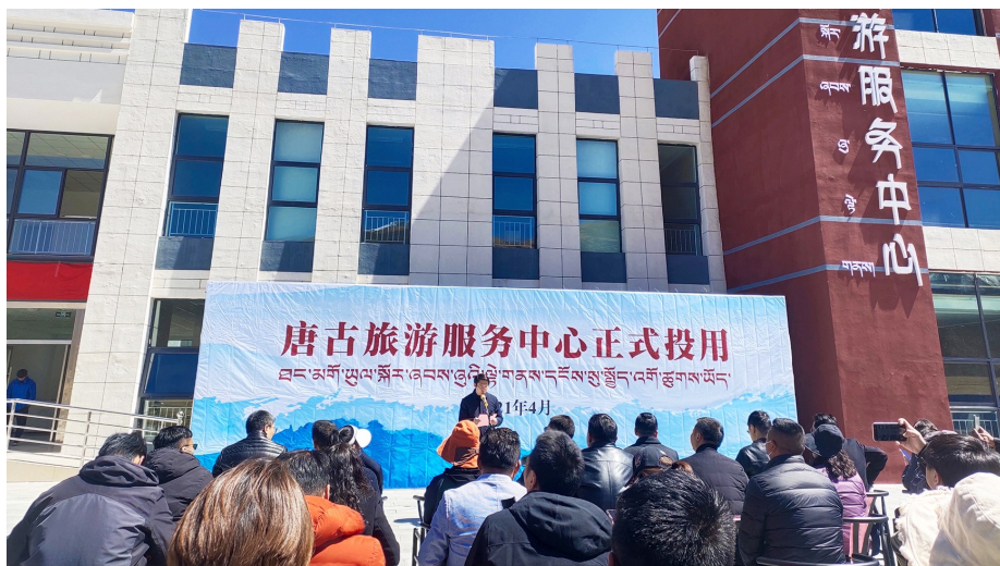
唐古旅游服务中心。