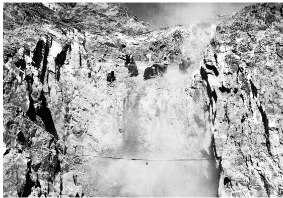
虎头山水库开工现场。