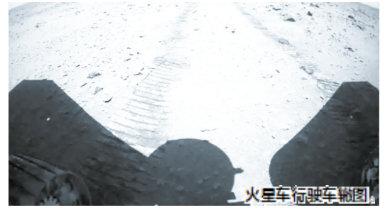
火星车行驶车辙图

后续，火星车将继续按计划开展移动、感知、科学探测，环绕器继续在轨运行在中继轨道，为火星车巡视探测提供中继通信，并开展环绕探测。（央视新闻）