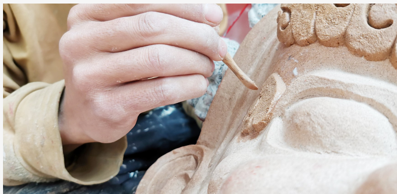
布塑艺人正在制作面具。