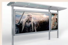
社区大牌 尺寸: 3.14m×1.33m