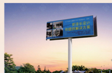
机场高速大牌 尺寸: 18m×6m

招租热线: 0891-6345589 13989097659 17889192520 13518976363