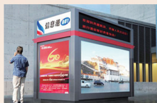
市区临街报刊亭 尺寸: 2.75m×1.5m