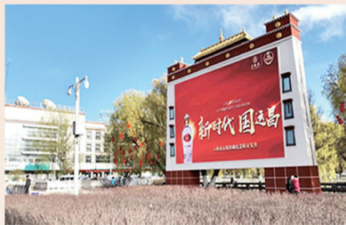
布达拉宫广场LED屏 (尺寸: 11.52m×7.68m)