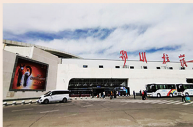
机场LED屏 (尺寸: 9.6m×6m)