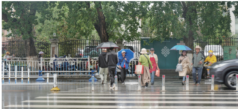
拉萨雨天。