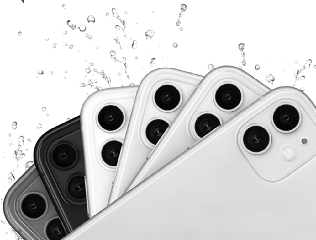
iPhone 11 参考价格:5499元起

当然,这款旗舰手机的硬件配置方面也都是旗舰级别,骁龙865处理器,4000mAh电池,超声波屏下指纹等,给这款手机带来了足够强劲的性能表现。对屏幕和拍照有极致追求的消费者可以考虑这款手机。有遐想灰、浮氧蓝和柔雾粉三种配色可选择。