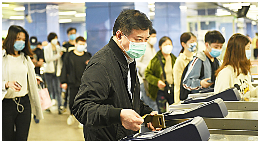
3月9日,乘客从广州地铁海珠广场站刷卡出站。

统计数据显示,返岗复工的农民工已达到7800万人,占今年春节返乡的60%。(新华网)