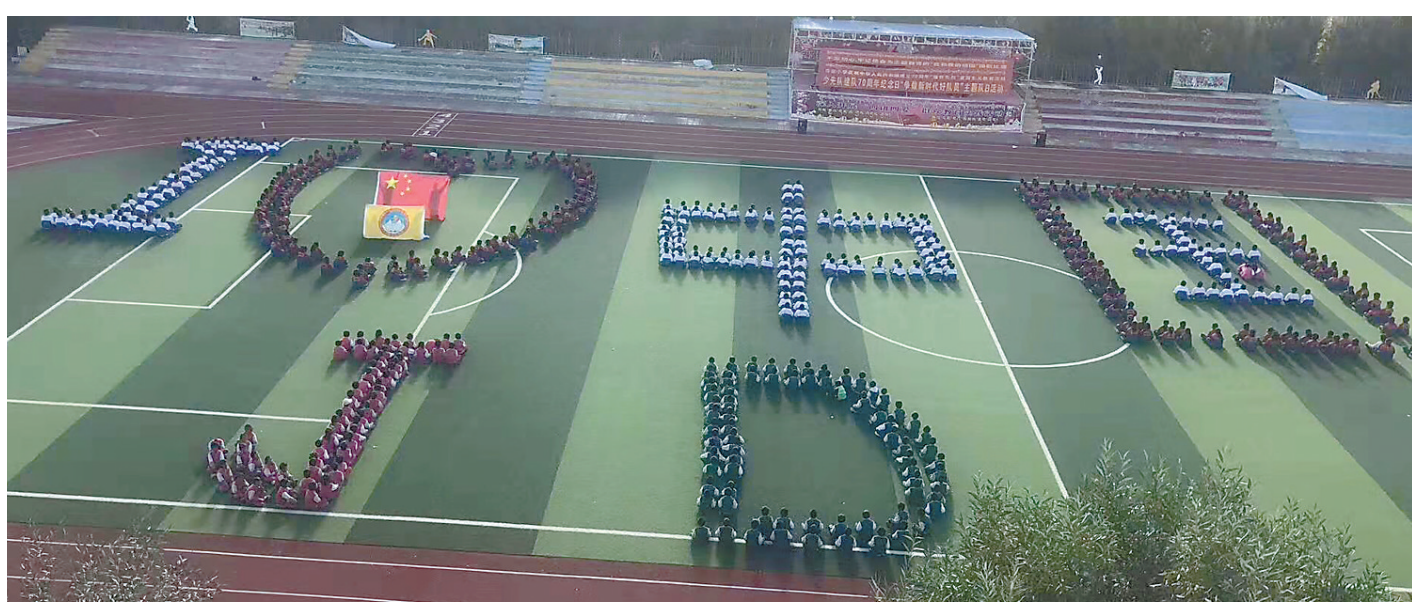
10月1日，萨迦县吉隆镇小学组织学生开展“祖国母亲生日快乐”庆祝活动。