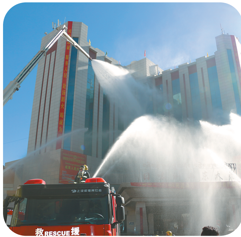
消防救援队开展大型商业综合体实战演练。