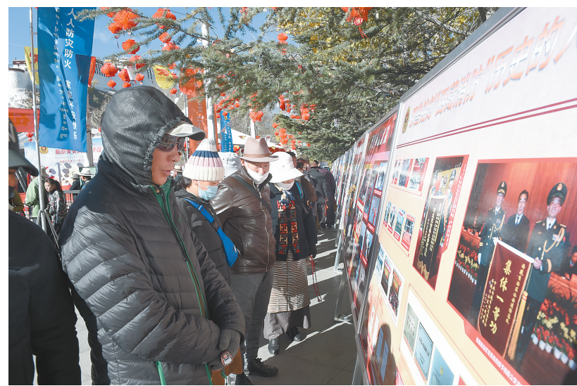
群众在活动现场参观消防队伍发展成果。