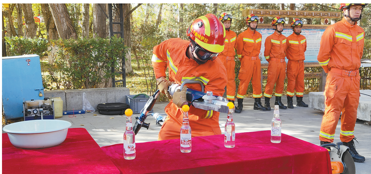
活动现场,消防员展示用液态扩张钳夹乒乓球。