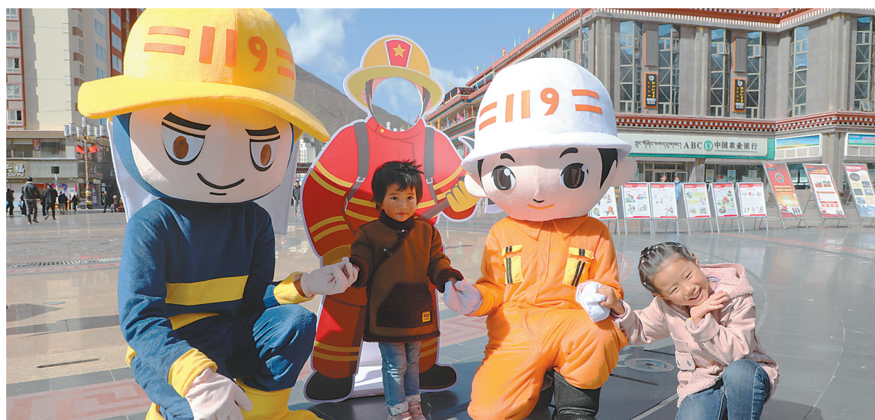
活动现场,消防卡通人物与小朋友互动。