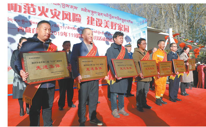
西藏自治区第二届“119”消防奖先进集体合影。