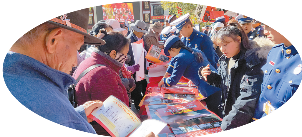
活动现场,消防工作人员向群众发放宣传资料。