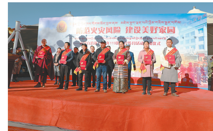
西藏自治区第二届“119”消防奖先进个人合影。