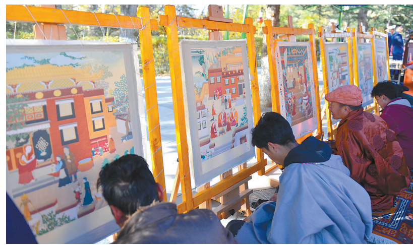
唐卡画师在活动现场创制消防宣传图。