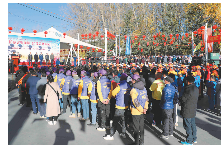
2019年“119消防宣传月”活动启动仪式现场。

11月7日上午,西藏自治区2019年“119消防宣传月”活动启动仪式在拉萨市宗角禄康公园举行。此次活动围绕习近平总书记向国家综合性消防救援队伍授旗致训词一周年和“防范火灾风险,建设美好家园”主题,精心设置了西藏消防救援队伍发展成就展、文物保护单位新型消防装备展、唐卡消防宣传图创制区、“中国梦·消防梦”互动涂鸦活动、“你的期盼,我的梦想”助力火焰蓝活动、消防宣传咨询服务区、初期火灾扑救体验等展区及互动体验区,开展了集消防科普、参观体验、互动娱乐于一体的宣传活动,让市民群众近距离了解西藏消防救援队伍发展建设成就,初期火灾扑救常识和灭火逃生设备器材使用方法。活动现场共发放消防宣传资料、宣传品3万余份,展出消防宣传装备器材和展板600余件套,吸引4000余名群众现场参观学习。