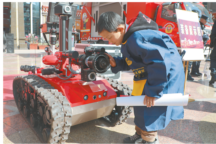
消防机器人走进活动现场。