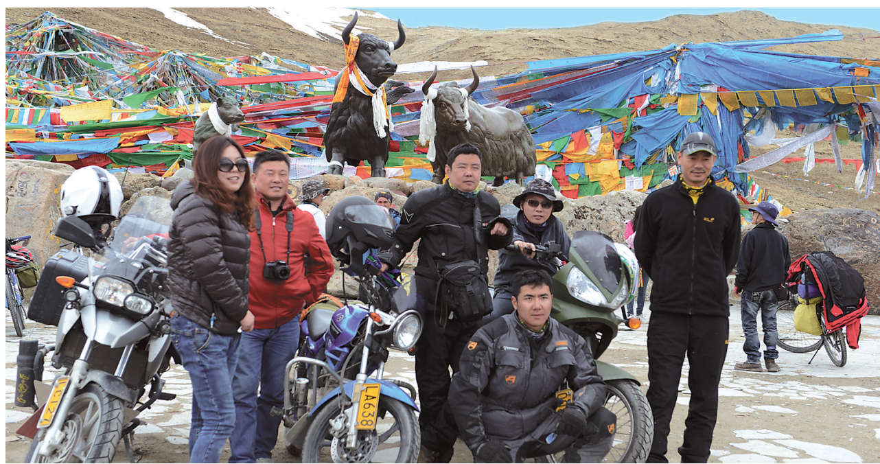
游客纷纷在念村的米拉山口旅游景点拍照留念。