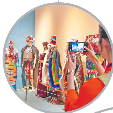
西藏服饰独具特色