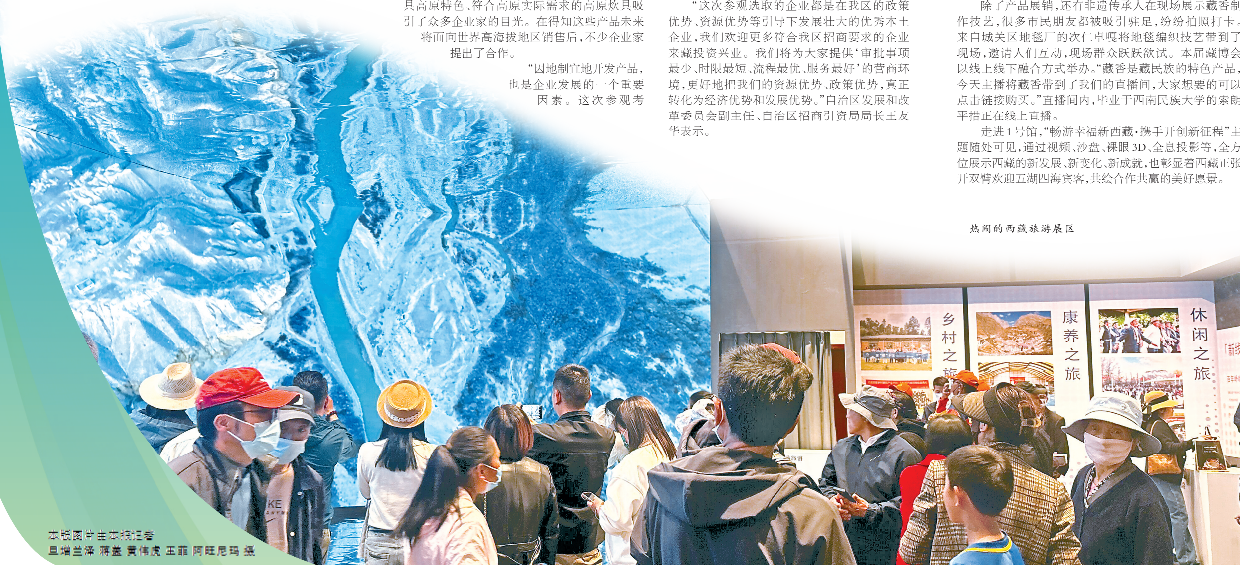
热闹的西藏旅游展区