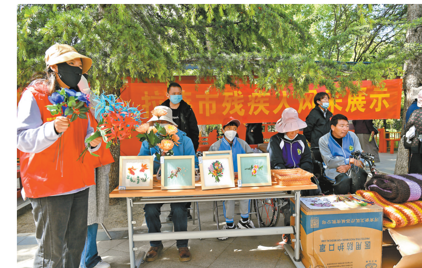
5月21日，拉萨市残联在宗角禄康公园开展了一系列全国助残日主题活动，倡导友爱、互助、融合、共享理念，营造扶残助残的良好社会氛围。图为活动现场，残疾人在展示自己精心制作的手工艺品。

围绕“大众创业、万众创新”，山南市建成帕哲农业科技众创空间等创新创业平台3家，吸纳入驻企业100家，带动高校毕业生就业500余人。江北新区产业孵化园、错那双创一条街、琼结创客、浪卡子高校毕业生创业一条街等县(区)创业平台累计吸纳入驻企业40家，带动就业200余人。同时，该市积极开展山南籍高校毕业生返乡创业试点工作，创新建立创业培训、社保减免、住房保障、水电补贴等创业扶持机制，明确每人最高5万元、每家企业最高20万元的创业资金扶持标准，兑现143名高校毕业生创业补贴资金共736.67万元。