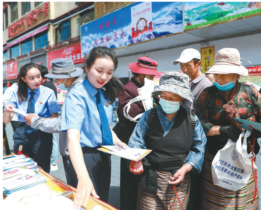
图为自治区人民检察院组织干警在拉萨街头开展普法宣传活动,广泛宣传扫黑除恶、未成年人保护、防范和打击电信网络诈骗犯罪等法律法规,现场解答群众法律咨询,提供法律帮助。