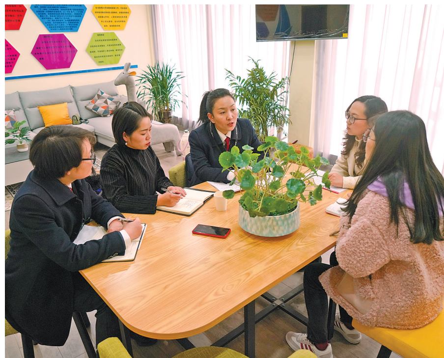
图为2021年3月4日,拉萨市首个未成年被害人“一站式”询问救助中心暨卓·吉未检工作室正式挂牌成立,开启了未成年被害人司法保护与社会综合保护的新模式。