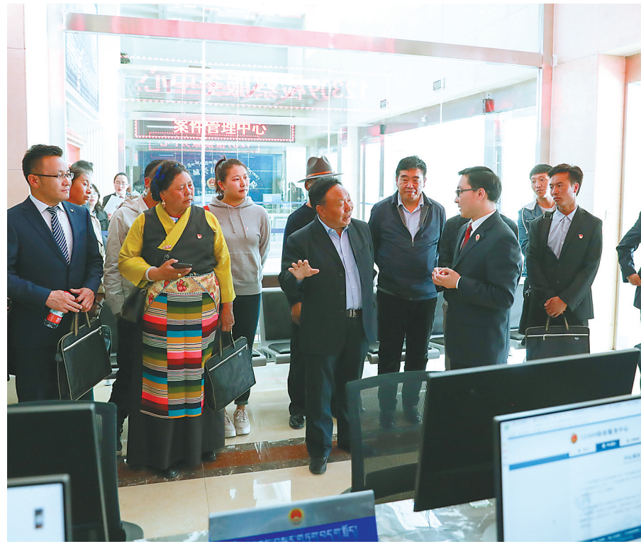
图为自治区人民检察院开展以“我将无我、奋斗,不负人民重托——共和国建设者走进检察机关”为主题的检察开放日活动,邀请全区各行各业的全国劳动模范、全区劳动模范和先进工作者代表走进检察机关,零距离了解和感受检察工作。