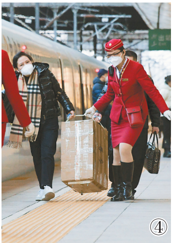
图①:旅客在郑州东站候车大厅内等候。 图②:动车组列车停靠在武汉动车段的存车线上(无人机拼接照片)。 图③:旅客和乘务员在G1373次列车上拿着新年装饰品合影留念。 图④:在北京西站,G1579次列车的乘务员在发车前帮旅客拿行李。