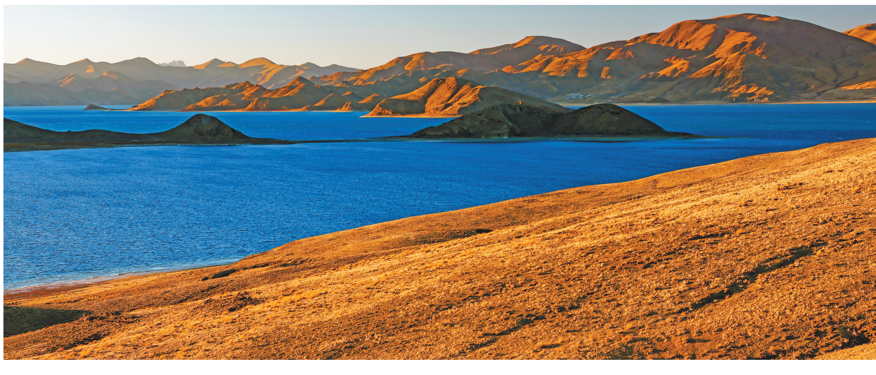
羊卓雍错简称羊湖，大部分位于山南市浪卡子县境内，湖面海拔4400多米。这是夕阳下的羊卓雍错(12月11日摄，无人机照片)。