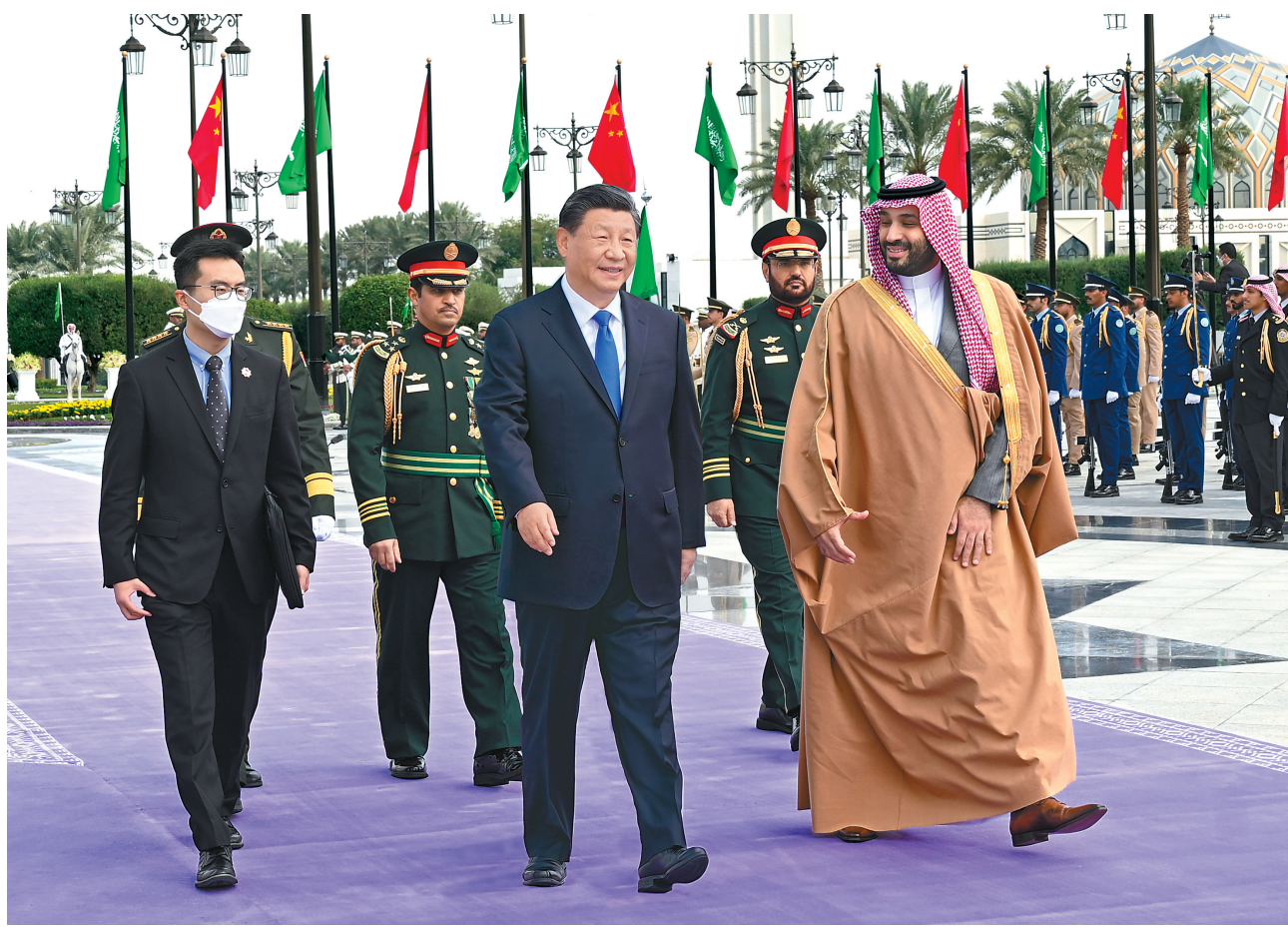
当地时间12月8日中午,沙特王储兼首相穆罕默德代表国王萨勒曼为正在沙特进行国事访问的国家主席习近平在利雅得王宫举行欢迎仪式。