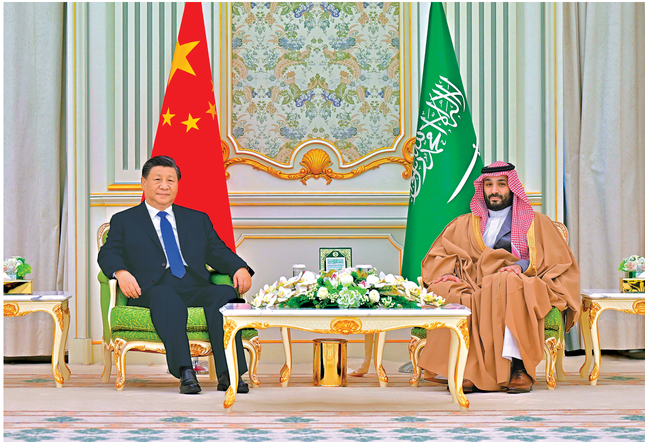
当地时间12月8日中午,国家主席习近平在利雅得王宫同沙特王储兼首相穆罕默德举行会谈。