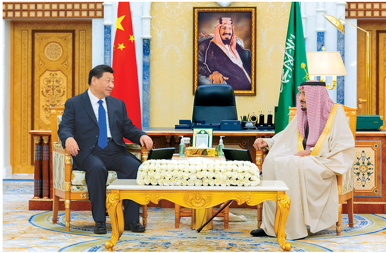
当地时间12月8日下午,国家主席习近平在利雅得王宫会见沙特国王萨勒曼。