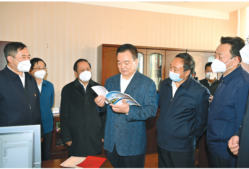
11月30日上午,自治区党委书记王君正在自治区自然资源系统进行调研。这是王君正来到自然资源厅,亲切看望干部职工,了解相关工作情况。

本报拉萨11月30日讯(记者 赵书彬)30日上午,自治区党委书记王君正在自治区自然资源系统调研时强调,要深入学习贯彻习近平生态文明思想,贯彻落实党的二十大关于推动绿色发展、促进人与自然和谐共生的决策部署,按照自治区第十次党代会、自治区党委十届三次全会要求,牢固树立和践行“绿水青山就是金山银山、冰天雪地也是金山银山”的理念,统筹做好经济发展与生态文明建设工作,坚定不移走生态优先、绿色发展之路,以高水平保护促进高质量发展,以高质量发展实现更高水平保护,创建国家生态文明高地,努力做到生态文明建设走在全国前列。