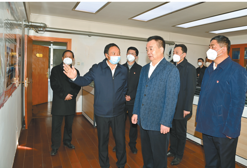
11月30日上午,自治区党委书记王君正在自治区自然资源系统进行调研。这是王君正来到自治区林草局拉萨南北山绿化指挥部办公室,详细了解项目进展等情况。