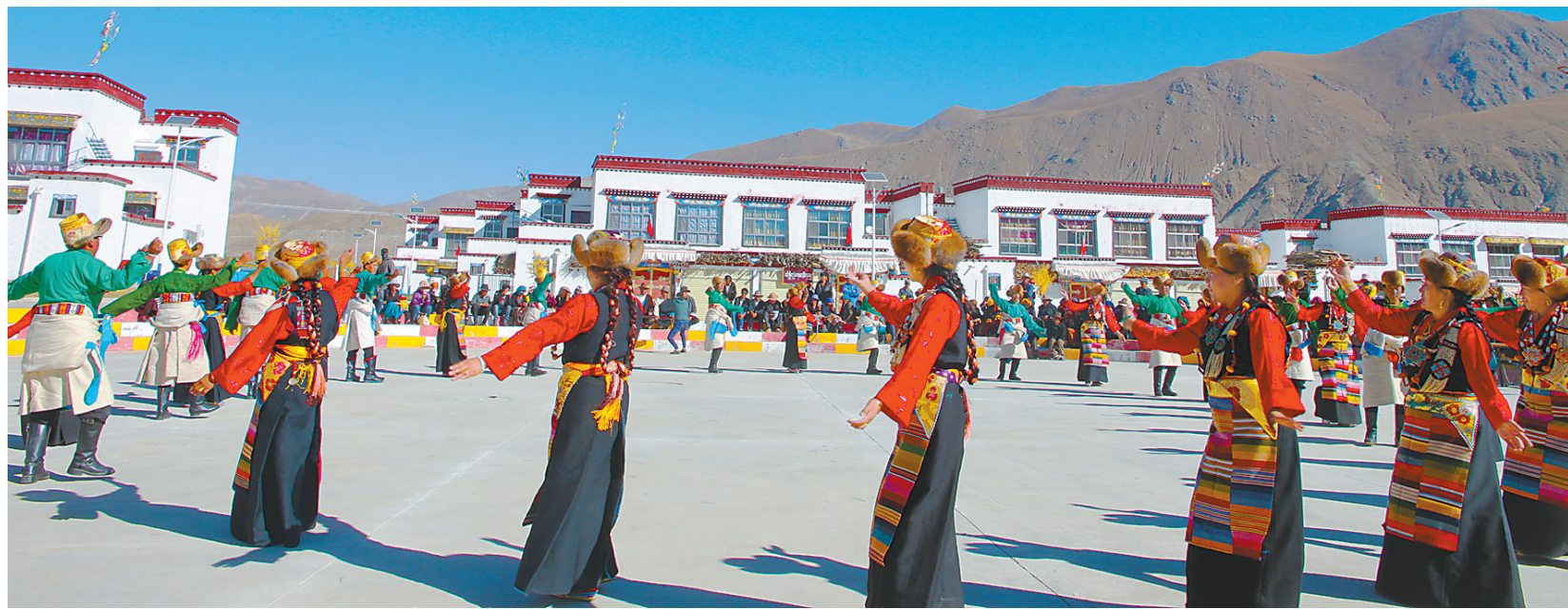
▲文艺事业繁荣兴盛，全区共有10个专业文艺团体、76个县区艺术团、153个民间藏戏队、395个乡镇文艺演出队，所有行政村成立群众文艺演出队。图为西藏自治区扎囊县德吉新村群众文艺演出队开展演出活动。