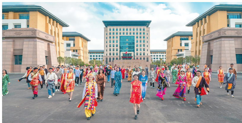
▲各族学生从新建成的西藏民族大学教学楼健步走出。