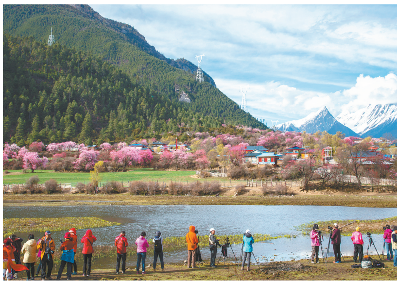
▲旅游业快速发展，全区旅游接待人数和旅游总收入分别由2012年的1058万人、126.47亿元增加至2021年的4153万人、441.90亿元。图为2021年4月西藏自治区林芝市桃花节迎来国内外游客。