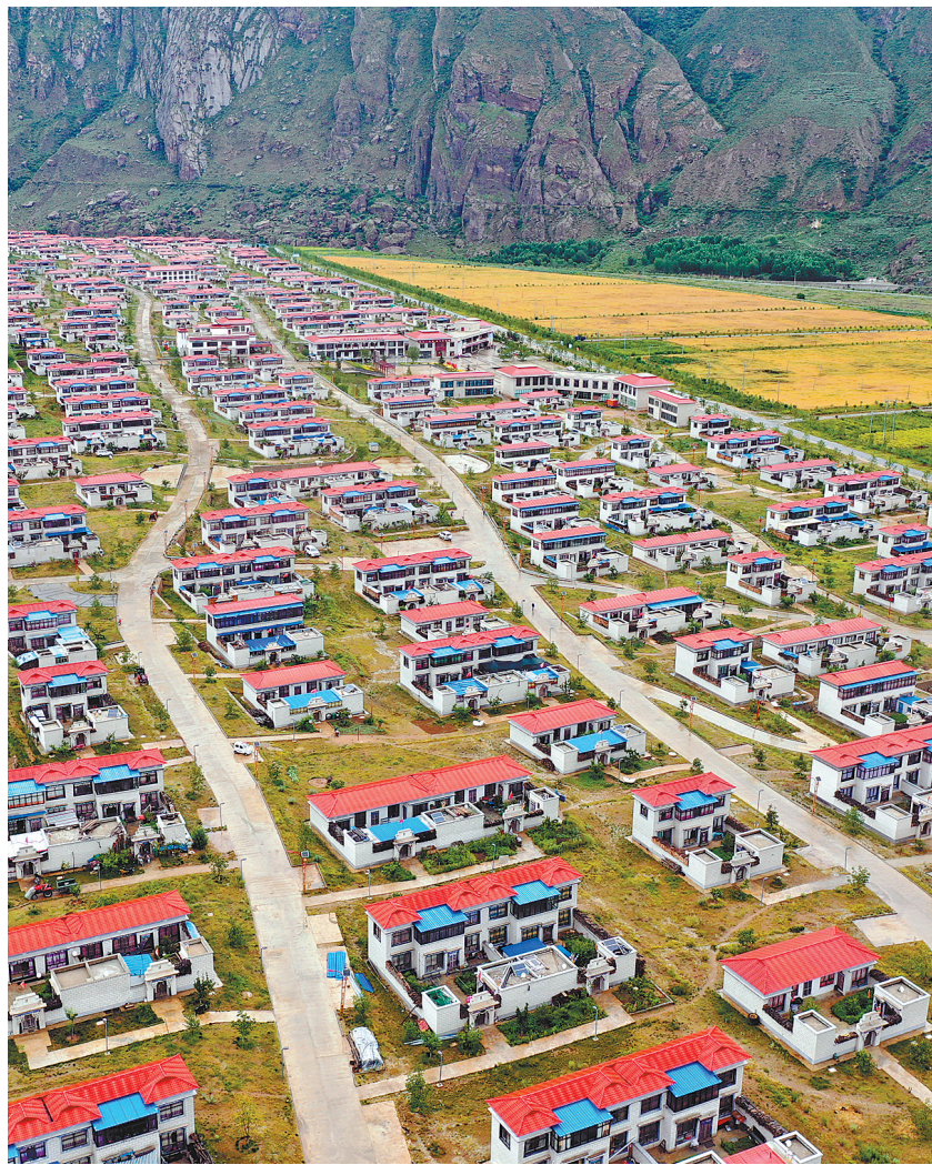
▲易地搬迁脱贫一批。2016年以来，累计投入198亿元，建成964个易地扶贫搬迁安置点，26.6万人搬迁入住。图为西藏自治区加查县共康村易地扶贫搬迁点。