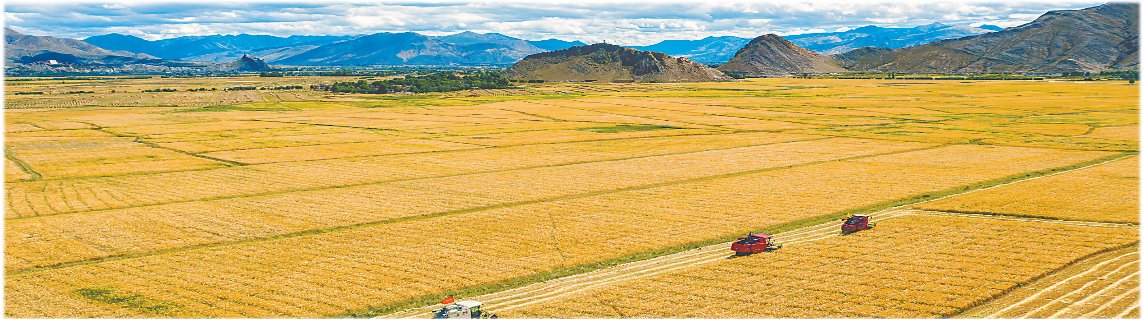
▲努力把资源优势转化为发展优势，做大做强高原特色产业，加快构建现代产业体系。2012年至2021年，城镇居民和农村居民人均可支配收入分别增长至46503元、16932元。图为西藏自治区江孜县紫金乡青稞种植喜获丰收。

着力创建高原经济高质量发展先行区，切实保障和改善民生，如期打赢脱贫攻坚战、全面建成小康社会，不断增强各族群众的获得感、幸福感、安全感。