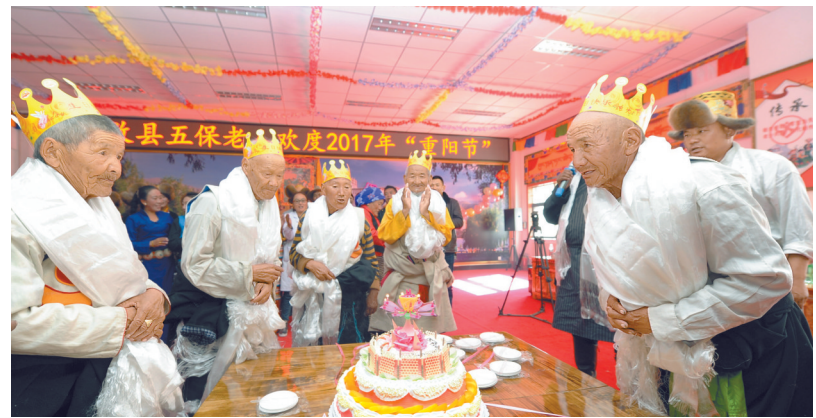
▲社会保障兜底一批。2021年，农村居民最低生活保障标准达到5060元/年/人，城镇居民最低生活保障标准达到10920元/年/人。图为2017年10月28日，西藏自治区拉萨市达孜区特困人员集中供养服务中心为80岁老人们集体过生日。