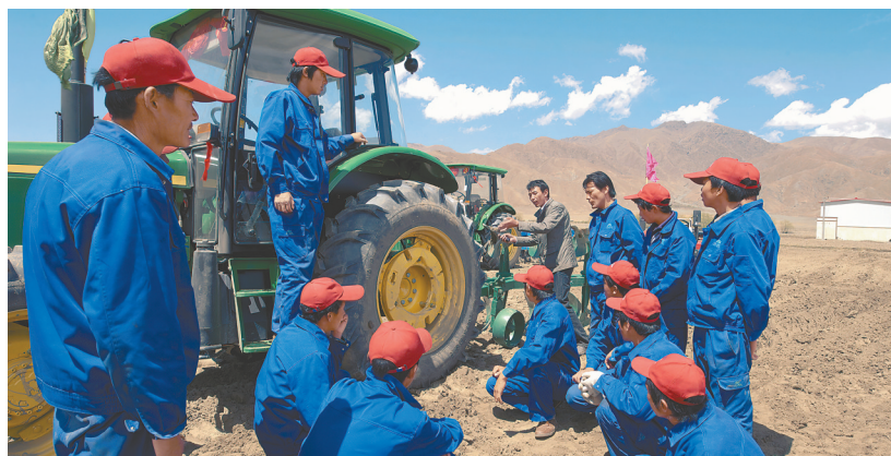
▲发展教育脱贫一批。2016年以来，累计落实义务教育学校基本建设资金84.4亿元，实施教育基础建设项目1433个，资助建档立卡和农村低保大学生累计6.06万人次，落实资助资金3.55亿元。图为西藏自治区白朗县邀请山东农机技师对当地贫困户开展培训。