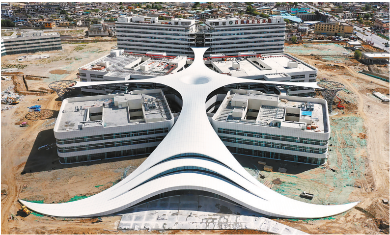
▲中央支持西藏自治区全面推进就业、教育、医疗、住房等重大民生工程项目建设。图为正在建设的西藏自治区医院。