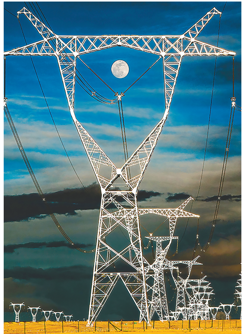
▲青藏、川藏、藏中、阿里电网联网,四条“电力天路”点亮西藏千家万户。2015年以来,累计外送电量92亿千瓦时。图为“电力天路”铁塔。