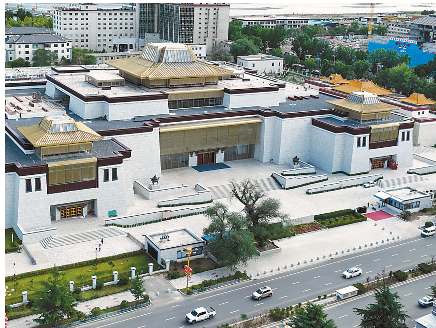
▲2022年7月8日,国家投资6.6亿元建设的西藏博物馆新馆开馆。新馆占地面积6.5万平方米,馆藏藏品52万余件,是一座集典藏、展示、研究、教育、服务等功能于一体的国家一级现代化综合博物馆。