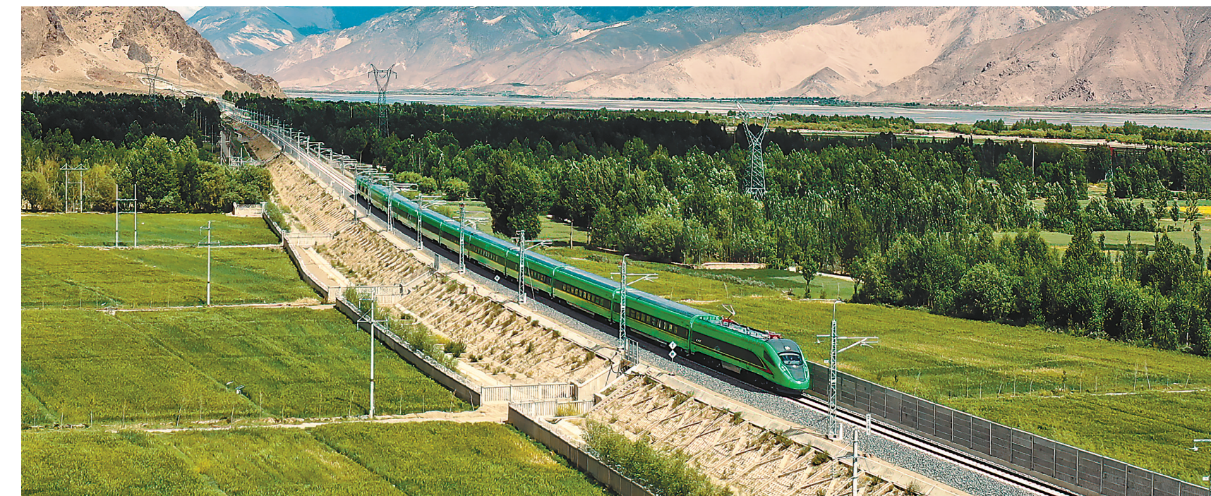
▲中央支持西藏自治区基本建成涵盖公路、铁路、航空、管道等多种运输方式的综合立体交通网络。2021年6月25日,川藏铁路拉林段正式开通运营。图为开通当日,复兴号高原内电双源动车组首次开上青藏高原。