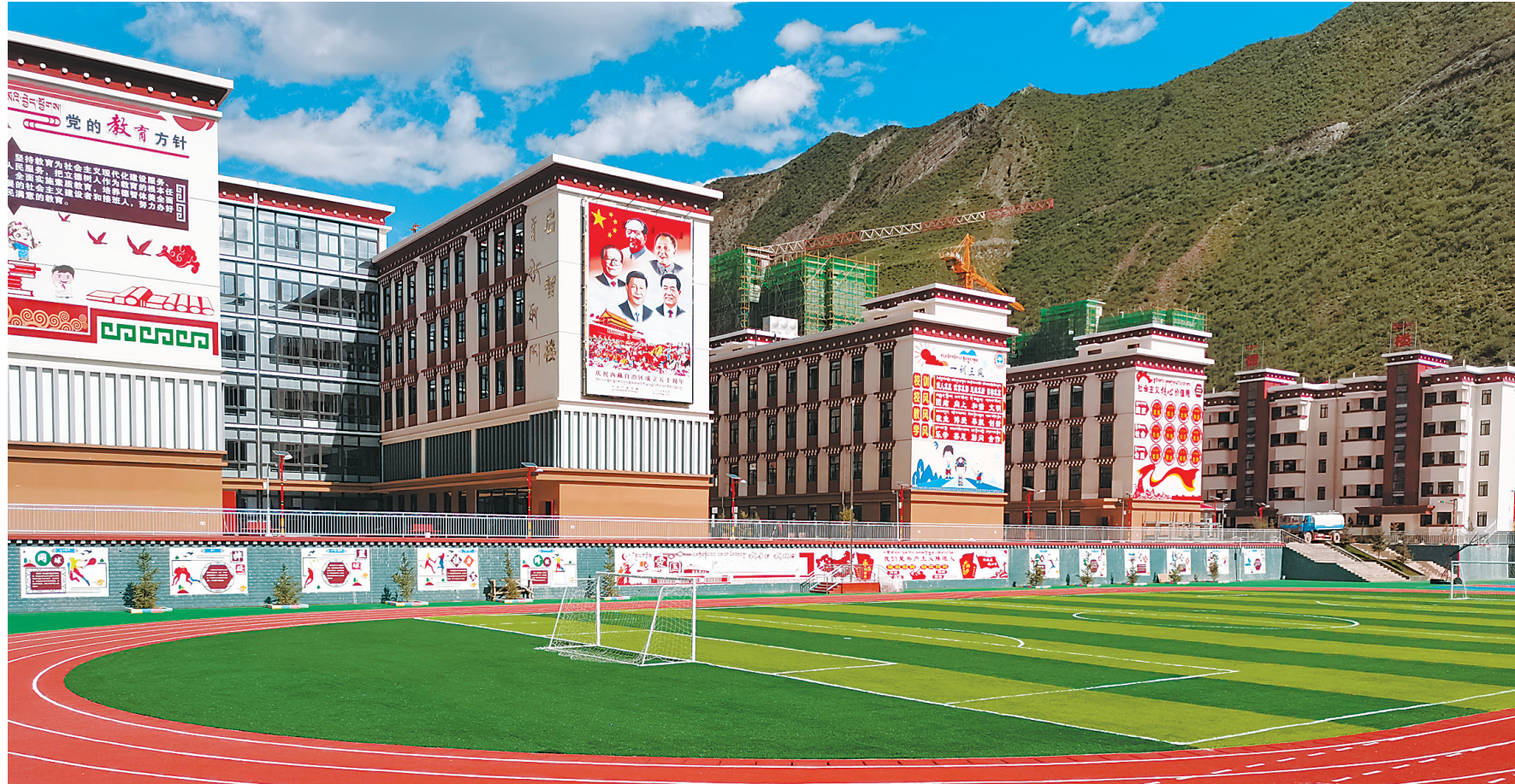
▲图为天津市援建的西藏自治区昌都市卡若区小学。

以习近平同志为核心的党中央高度重视西藏工作,确立新时代党的治藏方略,确定支持西藏的一大批重点项目,制定实施一系列特殊优惠政策,推进西藏长治久安和高质量发展。