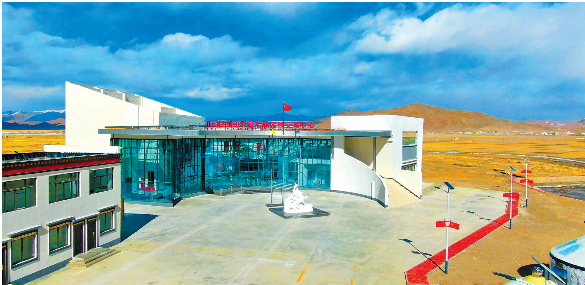
由河北省第九批援藏工作队投资1600万元援建的日土县白绒山羊绒毛品鉴暨交易中心通过市场化运作,逐步成为藏西北优质羊绒的集散地,有效带动了当地牧业发展和牧民增收。图为交易中心一角。