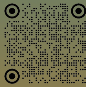
西藏日报藏文媒体微信公众号