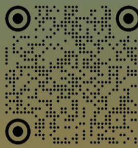
西藏日报微信公众号