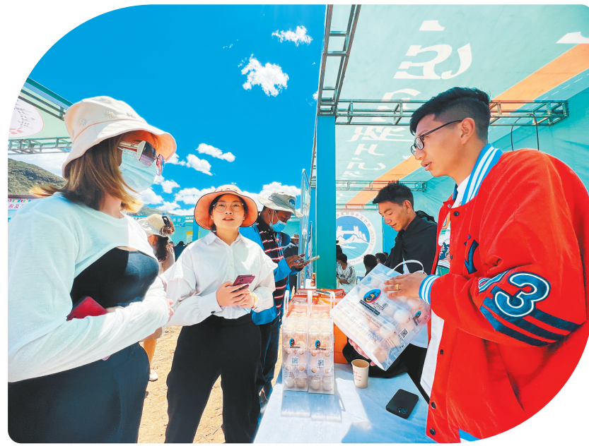
展品展示展销现场。