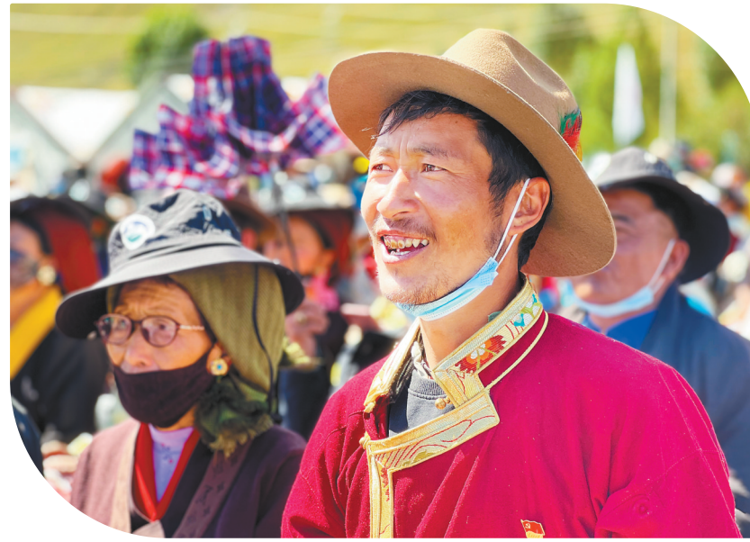
开幕式现场的群众。