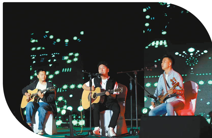
民俗音乐会现场。