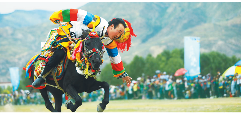
民族传统体育比赛现场。