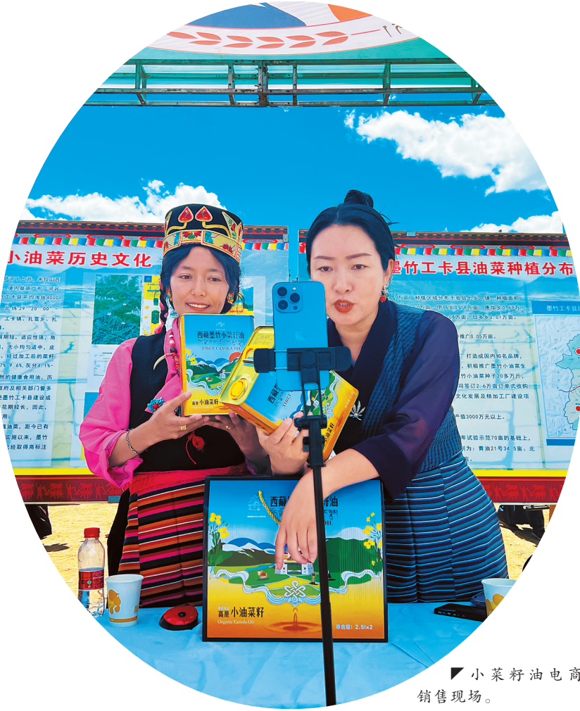
小油菜籽电商销售现场。

据悉，今年墨竹工卡县2022年松赞文化旅游节暨第五届油菜花节活动分为扎西岗乡主会场和嘎则新区幸福林分会场，共设置了以“油”为主题的13项子活动。开幕式上，墨竹工卡县净土公司代表与唐加乡人民政府代表进行了“小油菜籽”认购签约，墨竹工卡县净土公司代表与扎西岗乡人民政府代表进行了“小油菜籽”预售签约。