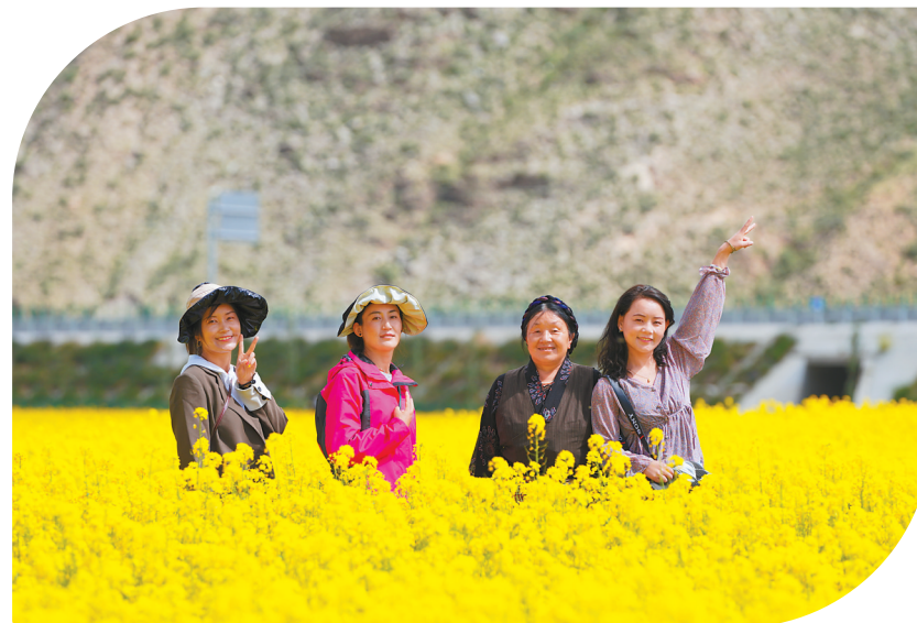
市民在油菜花田拍照留影。