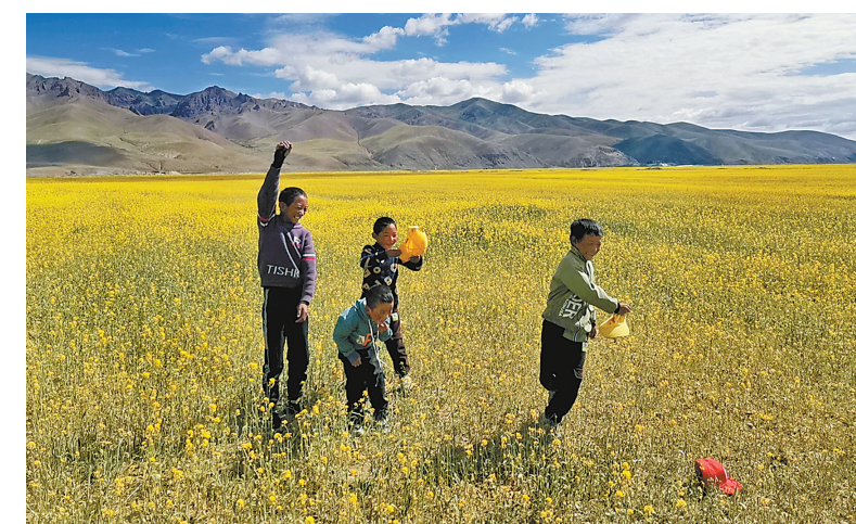
图为凯玛村的孩子们在油菜花海里玩耍。