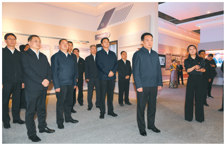
6月30日下午,自治区党委书记王君正带领自治区级领导干部在拉萨集体参观自治区廉政警示教育展。

本报拉萨6月30日讯(记者 赵书彬 张黎黎)在“七一”建党节来临之际,30日下午,自治区党委书记王君正带领自治区级领导干部在拉萨集体参观自治区廉政警示教育展,现场接受党性党风党纪教育。强调,要深入学习贯彻习近平总书记关于全面从严治党、西藏工作的重要指示和新时代党的治藏方略,坚定不移扛起管党治党政治责任,认真落实全面从严治党总体要求,增强斗争意识,以自我革命精神坚守初心使命,始终保持党的先进性和纯洁性,奋力推进西藏长治久安和高质量发展。 自治区领导严金海、庄严、陈永奇、刘江、王卫东、汪海洲、赖蛟、任维、普布顿珠、嘎玛泽登、肖友才、达娃次仁等参加。 自治区廉政警示教育展共分为“党要管党、从严治党”“反腐形势、严峻复杂”“改进作风、狠抓落实”“以案为鉴、警钟长鸣”四个单元。王君正等自治区领导逐一参观各展览单元,认真听取工作人员介绍,仔细观看案例展示和文字剖析。 (下转第四版)