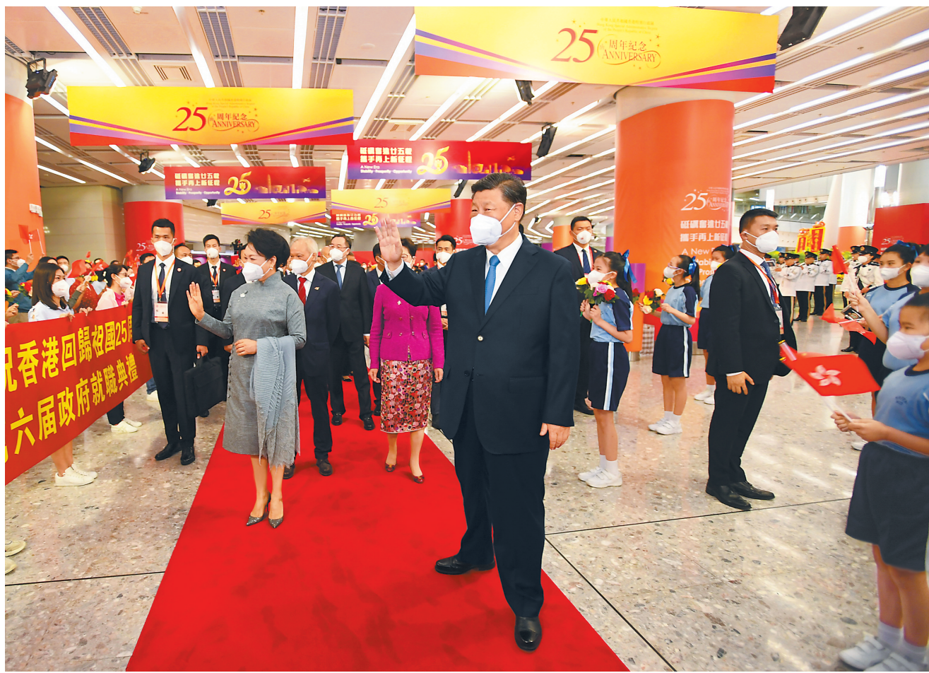
6月30日下午,中共中央总书记、国家主席、中央军委主席习近平乘专列抵达香港,出席将于7月1日举行的庆祝香港回归祖国25周年大会暨香港特别行政区第六届政府就职典礼,并视察香港。这是习近平和夫人彭丽媛向欢迎的人群挥手致意。

新华社香港6月30日电(记者 朱基钗 陈键兴)中共中央总书记、国家主席、中央军委主席习近平30日下午乘专列抵达香港,出席将于7月1日举行的庆祝香港回归祖国25周年大会暨香港特别行政区第六届政府就职典礼,并