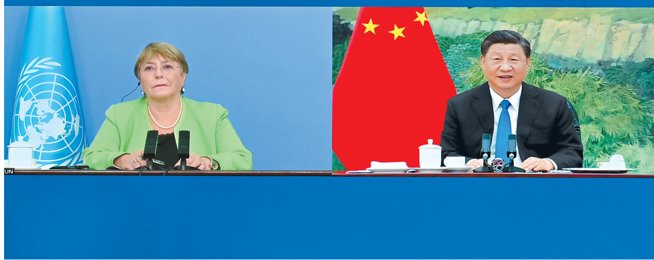
5月25日，国家主席习近平在北京以视频方式会见联合国人权事务高级专员巴切莱特。