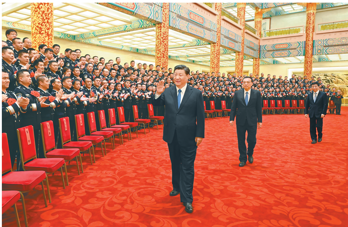
5月25日，党和国家领导人习近平、李克强、王沪宁等在北京人民大会堂会见全国公安系统英雄模范立功集体表彰大会代表。

新华社北京5月25日电 全国公安系统英雄模范立功集体表彰大会25日上午在京举行。中共中央总书记、国家主席、中央军委主席习近平亲切会见会议代表，向他们表示热烈祝贺，向全国广大公安民警辅警致以诚挚问候。