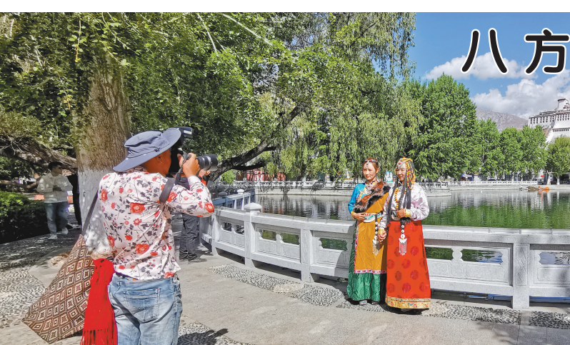
图为近日，游客在拉萨市宗角禄康公园合影留念。

优惠奖励(补助)措施包括：发放旅游消费券3000万元；全区A级景区对长期从事疫情防控的医务工作者、公安干警以及特殊群体(现役军人、残疾人)免门票，针对区内游客出团减免景区门票措施的A级以上景区可获相应补贴；对组织区内旅游人数达到200人及以上的旅行社给予相应资金奖励，达到800人以上全区排名前10的旅行社，每家再增加20万元奖励，沿