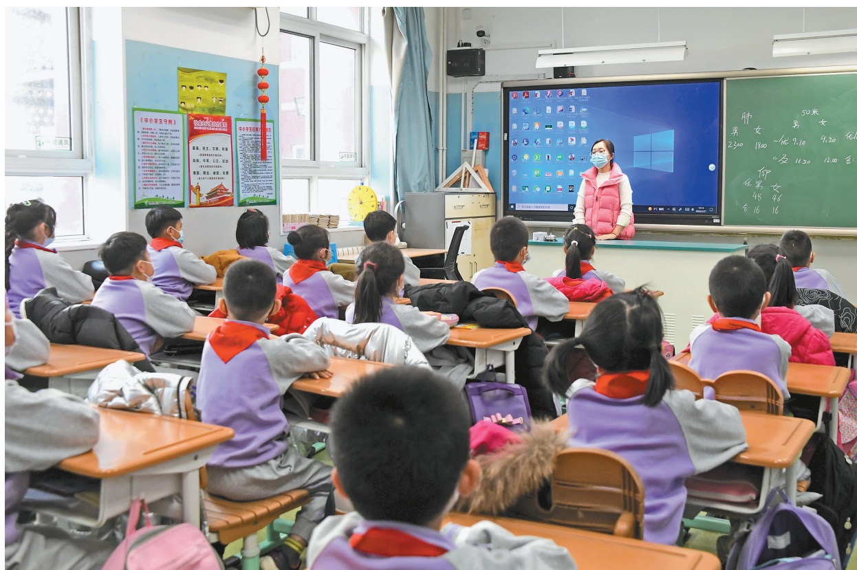
2月21日,在北京市海淀区双榆树第一小学,二年级(2)班的学生在上数学课。