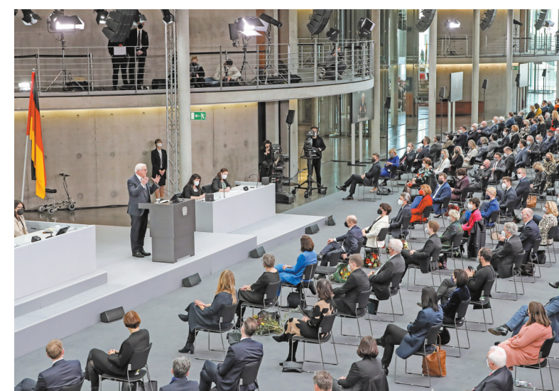
德国现任总统施泰因迈尔13日在第17届德国联邦大会总统投票选举中获胜,成功连任。