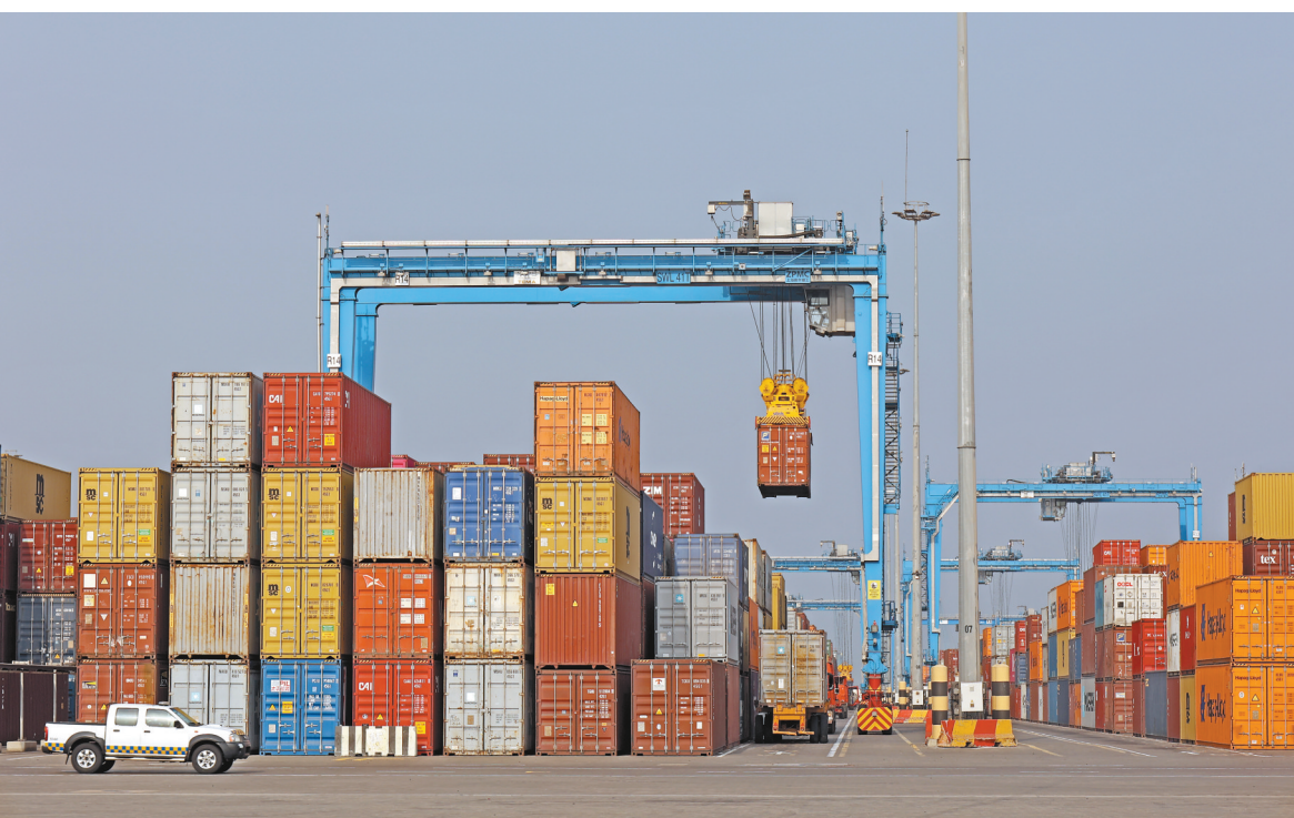
图为加纳第一大港口特马港(2月14日摄)。