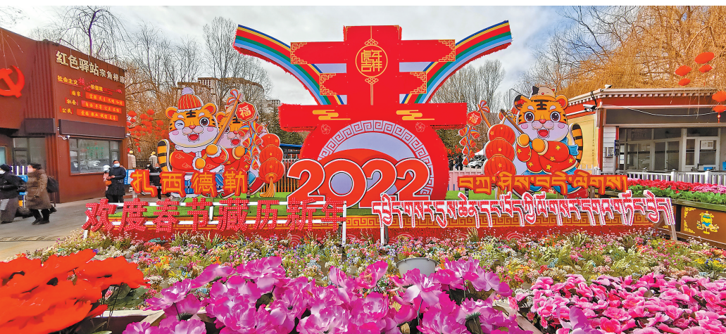
▲拉萨宗角禄康公园装扮一新庆新春。