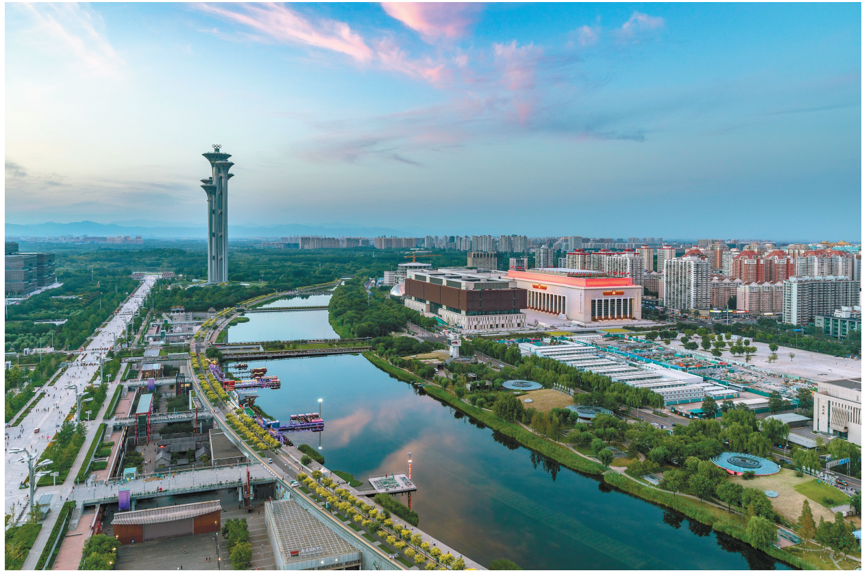
图为北京奥林匹克公园(2021年8月17日摄)。