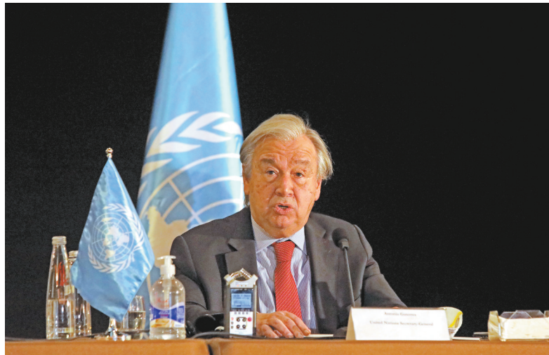
联合国秘书长古特雷斯21日在黎巴嫩首都贝鲁特表示,联合国将采取包括举办国际会议在内的多项举措,动员国际社会支持深陷危机的黎巴嫩。图为12月21日,联合国秘书长古特雷斯在黎巴嫩首都贝鲁特出席记者会。