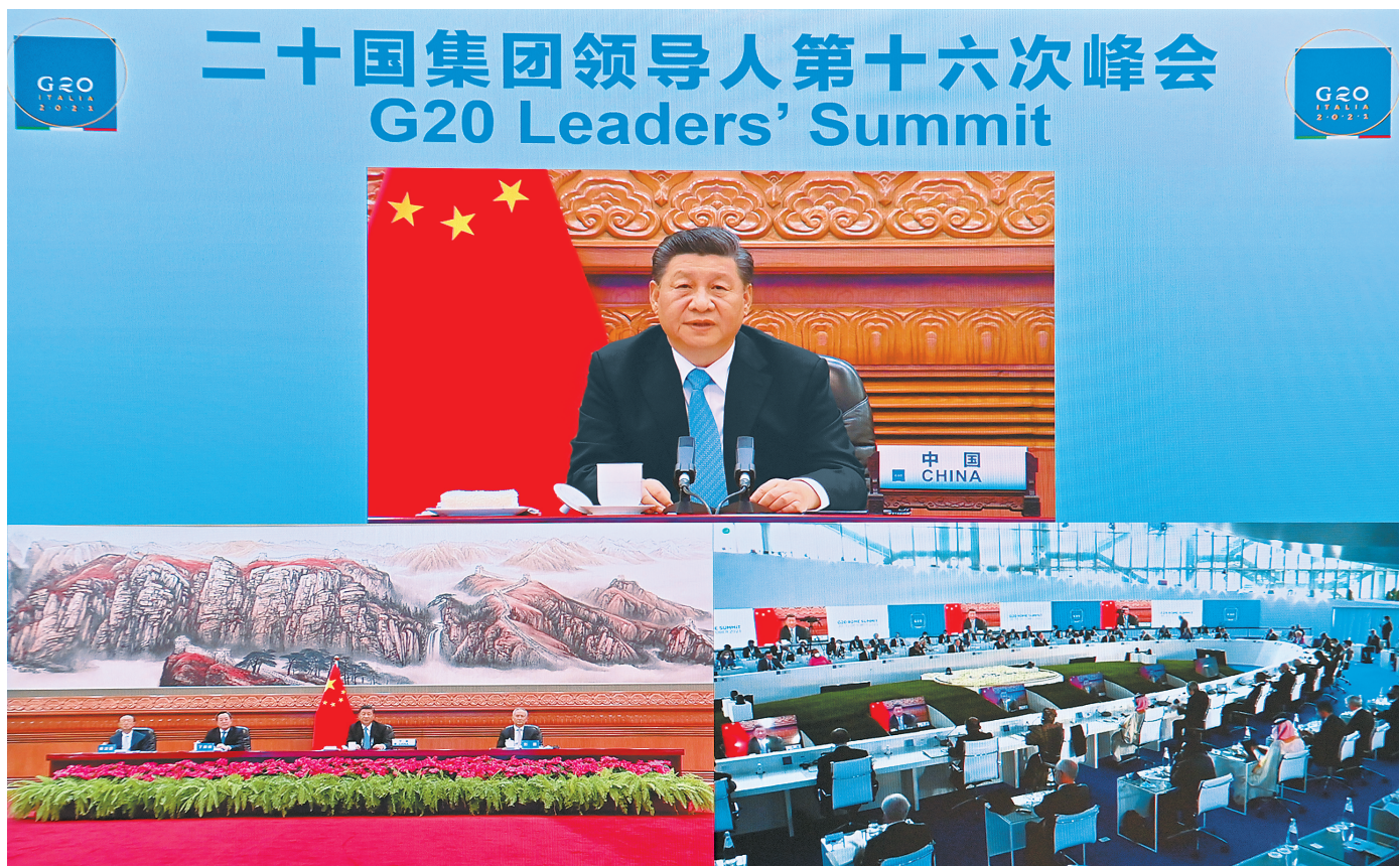
10月31日晚，国家主席习近平在北京继续以视频方式出席二十国集团领导人第十六次峰会。

新华社北京10月31日电 国家主席习近平31日晚在北京继续以视频方式出席二十国集团领导人第十六次峰会，重点阐述对气候变化、能源、可持续发展等问题的看法。 习近平指出，气候变化和能源问题是当前突出的全球性挑战，事关国际社会共同利益，也关系地球未来。国际社会合力应对挑战的意愿和动力不断上升，关键是要拿出实际行动。第一，采取全面均衡的政策举措。必须统筹环境保护和经济发展，兼顾应对气候变化和保障民生，主要经济体应该就此加强合作。第二，全面有效落实《联合国气候变化框架公约》及其《巴黎协