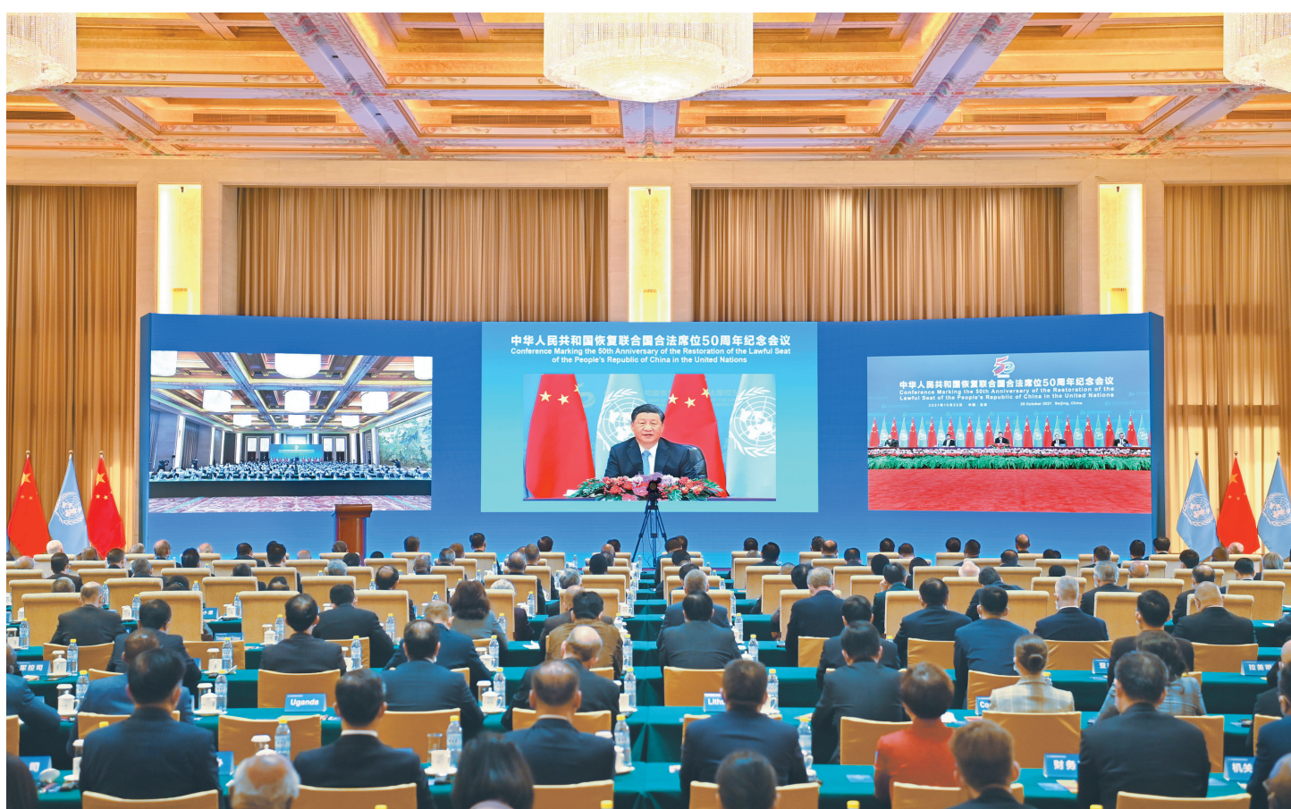
10月25日,国家主席习近平在北京出席中华人民共和国恢复联合国合法席位50周年纪念会议并发表重要讲话。