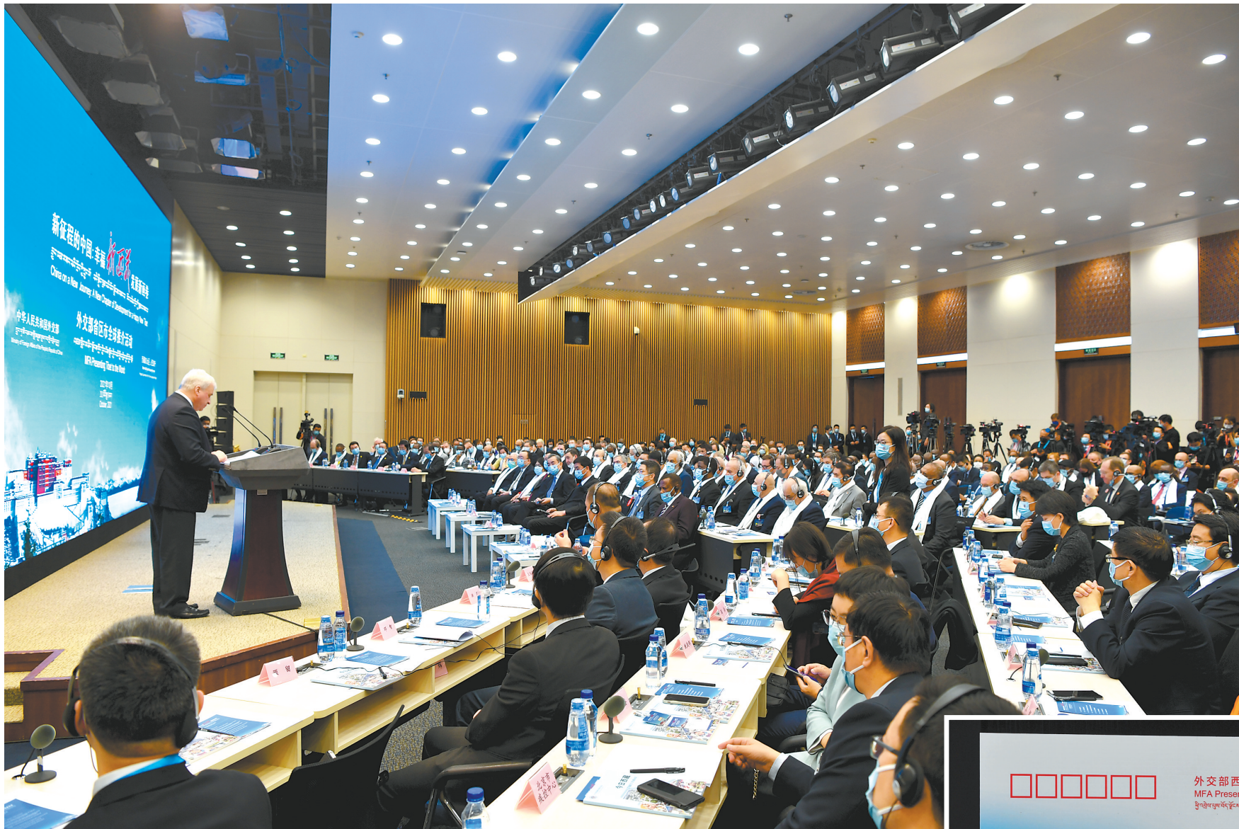
▲图为10月20日，外交部与西藏自治区人民政府在北京联合举行以“新征程的中国：幸福新西藏 发展新画卷”为主题的外交部西藏全球推介活动。