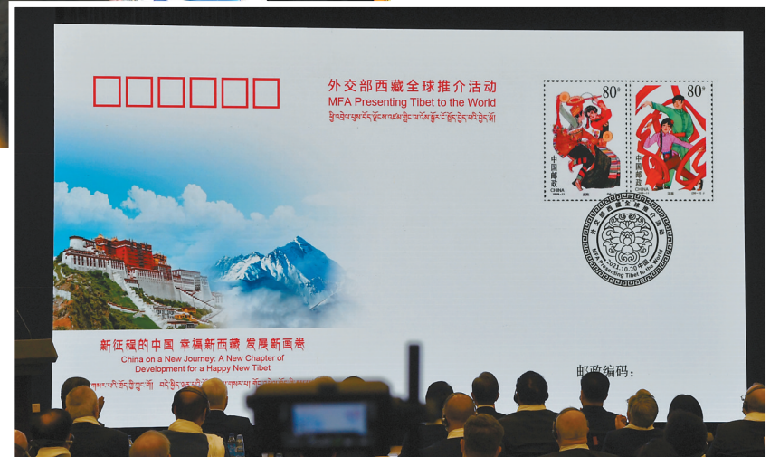
▼因为在推介会上发布的西藏全球推介活动外交纪念封。

蓝厅走廊，人流如织，目光交汇。一组组新旧对比照片让大家直观地感受到西藏和平解放70年来，全区各族群众生产生活发生的翻天覆地变化。西藏和平解放前，三大领主以野蛮、残酷的刑罚维护封建农奴制度，占总人口95%的农奴和奴隶生活极为贫苦，人民生命健康难以得到保障，交通设施极端落后。和平解放70年来，西藏作为特殊的边疆少数民族地区，始终得到了党中央的亲切关怀，尤其是党的十八大以来，在以习近平同志为核心的党中央坚强领导下，在全国人民大力援助下，自治区党委、政府团结带领全区各族干部群众自力更生、艰苦奋斗，推动各项事业取得全方位进步、历史性成就。今天的西藏，医疗条件得到全面改善，人均寿命由1951年的35.5岁增加到2020年的72.19岁，广大群众享受到各种优惠政策；铁路、航空、公路四通八达，“复兴号”驰骋拉林铁路，“空中金桥”飞架67个城市，群众生活实现了从帐篷到楼房、从水桶到水管、从油灯到电灯的进步，与全国人民一道过上了全面小康生活。 “繁荣发展”“和谐幸福”“文化昌