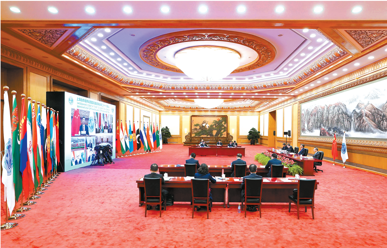
9月17日,国家主席习近平在北京以视频方式出席上海合作组织成员国元首理事会第二十一次会议并发表重要讲话。